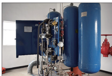
(2) 气液联动执行机构